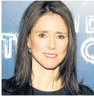
Als Regisseurin wurde Julie Taymor geschasst – dennoch ist sie Mit-Autorin des „Spider-Man“-Musicals.

Ob die Investoren von ihren Geldern irgendwann auch nur einen Cent wiedersehen, steht in den Sternen. Denn laut den Berechnungen eines findigen Mathematikers müsste das Stück angeblich mindestens zwölf Jahre laufen, ehe die Gewinnzone in Sichtweite kommt. Und so ungern man den Pessimisten spielt, aber danach sieht es im Moment nicht aus. Seit den