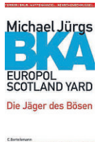
Michael Jürgs: „BKA. Die Jäger des Bösen“. Bertelsmann, 351 Seiten; 19,99 Euro.