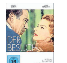
Bernhard Wicki: „Der Besuch“ (Winklerfilm).